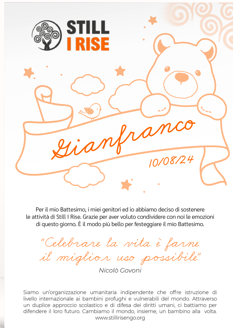
Nascita o battesimo 1