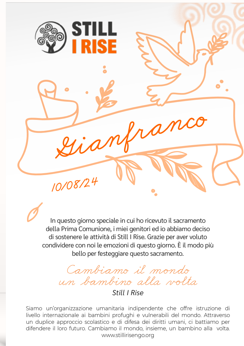
Comunione o Cresima 2