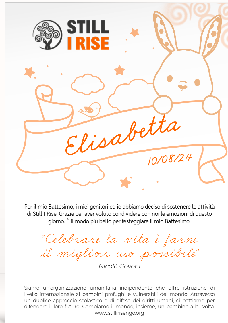
Nascita o battesimo 2