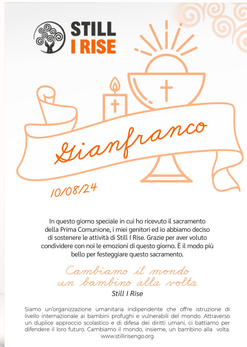
Comunione o Cresima 1