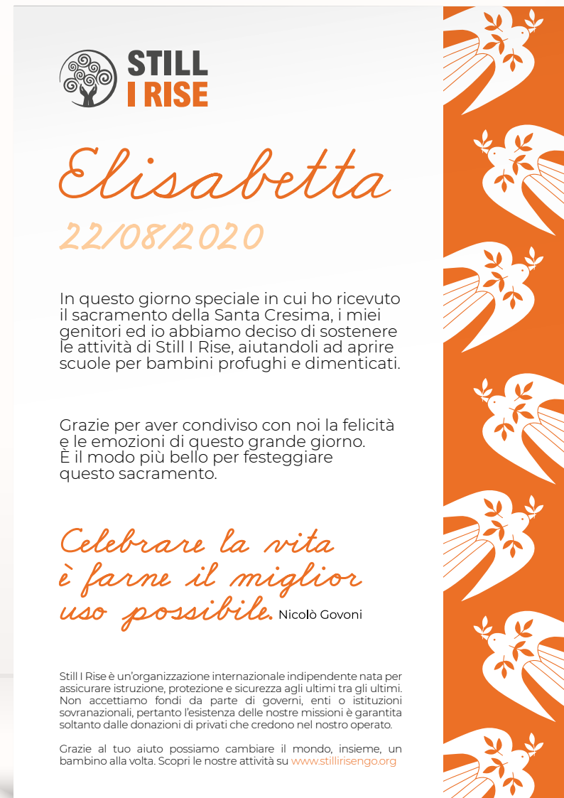
Comunione o Cresima 2