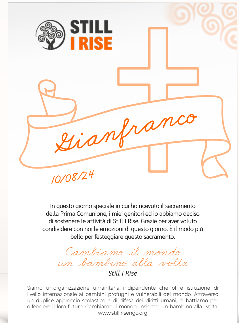
Comunione o Cresima 3