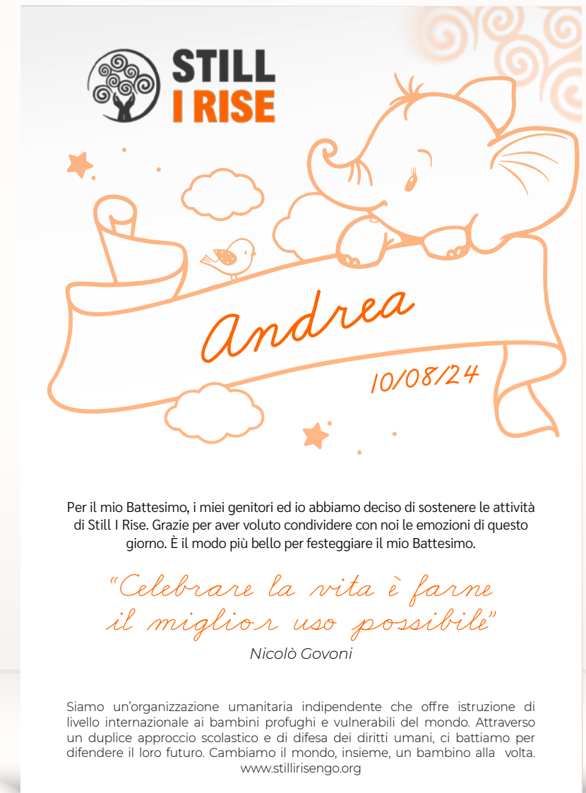
Nascita o battesimo 3